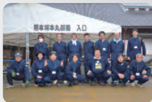
熊本城施工スタッフ

エコボロン®PRO は専門知識を持った認定施工店が、高品質な施工を実施いたします。