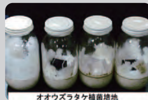
オオウズラタケ菌培養地

エコボロン®PRO は京都大学、東京農業大学、(財)建築研究協会などで防腐性能が確認されています。